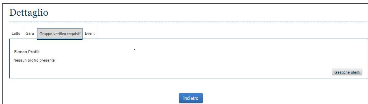
Figura 8 - TAB Gruppo Verifica Requisiti

Il pulsante "Gestisci Utenti" permette di accedere alla funzione per la l'associazione o rimozione di figure specifiche e relative funzioni.