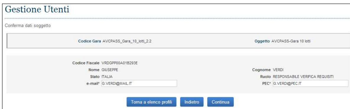
Figura 12 - Conferma Soggetto

Una volta selezionata la funzione, sarà necessario indicare il C.F. dell'utente che sarà investito da tale ruolo.