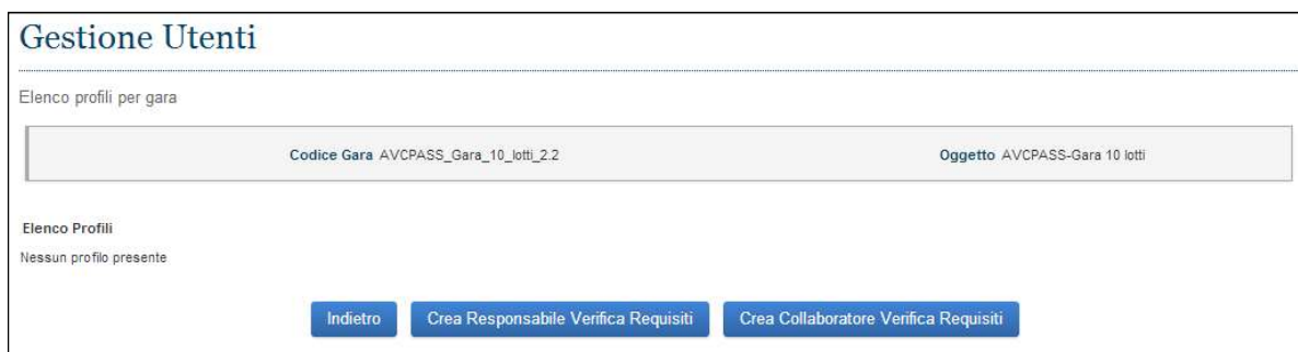
Figura 10 - Gestione Utenti

Per quanto concerne il Collaboratore, le attività saranno limitate a funzioni di verifica.