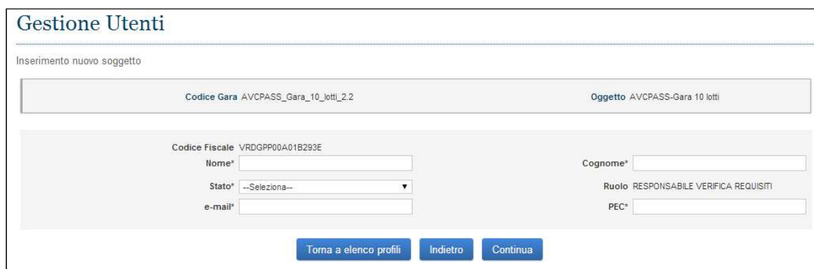
Figura 15 - Inserimento Componente in Anagrafica

Per inserire i dati del soggetto da inserire in anagrafica è necessario compilare la schermata "Inserimento nuovo soggetto", dove tutti i campi sono obbligatori.