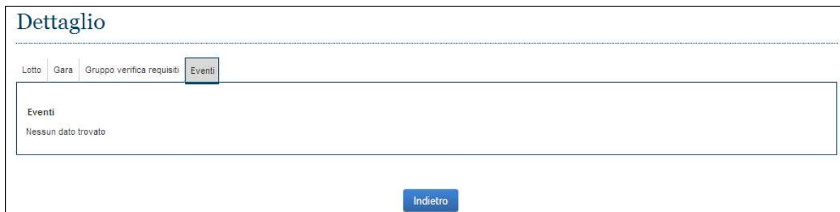
Figura 9 - TAB Eventi