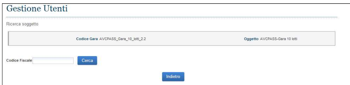
Figura 11 Ricerca soggetto

Le funzioni disponibili sono distinte per i due ruoli, quello di Responsabile e quello di Collaboratore, in quanto il Collaboratore ha di default già preimpostati i propri compiti, mentre il Responsabile dispone di un set di funzioni che possono essere personalizzate su ogni singolo profilo.